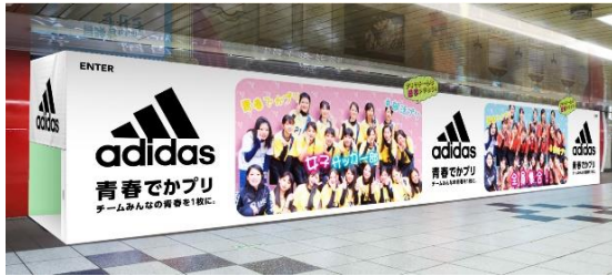
2019年度、第3回のプランニング部門 グランプリ作品「青春でかプリ」