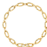
セルバンポエム ヴィンテージ ネックレス 価格：5,478,000円（税込） 素材：イエローゴールド、ダイヤモンド(0.64ct)

インスピレーション源となったアーカイブ作品のチェーンは、デザインモチーフとして使用しています。