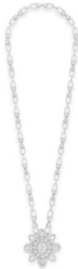
セルパンボエム ヴィンテージ ネックレス 価格：79,200,000円（税込） 素材：ホワイトゴールド、ダイヤモンド(71.21ct)