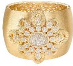
セルパンボエム ヴィンテージ カフブレスレット 価格：21,912,000円（税込） 素材：イエローゴールド、ダイヤモンド(5.45ct)

このカフブレスレットは、新作セルパンボエム ヴィンテージでも特にアイコン的な作品で、洗練されたヴィンテージの魅力をまとうサテン仕上げのカフに、インパクトのあるフラワーモチーフが存在感を放ちます。