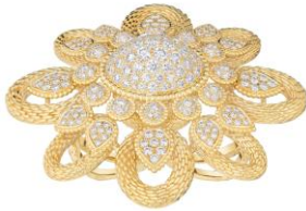
セルパンボエム ヴィンテージ トゥーフィンガー リング 価格：13,200,000円（税込） 素材：イエローゴールド、ダイヤモンド(9.74ct)

このカフブレスレットは、新作セルパンボエム ヴィンテージでも特にアイコン的な作品で、洗練されたヴィンテージの魅力をまとうサテン仕上げのカフに、インパクトのあるフラワーモチーフが存在感を放ちます。