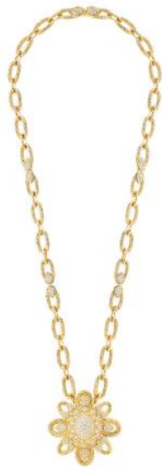
セルパンボエム ヴィンテージ ネックレス 価格：29,172,000円（税込） 素材：イエローゴールド、ダイヤモンド(12.95ct)

そしてクレールは70年代の自由で大胆なムードを持つアーカイブ作品をモダンなアプローチで再解釈し、新作セルパンボエム ヴィンテージが生まれました。アイコン的なドロップモチーフに用いられていたカラーストーンは、ダイヤモンドに代わりました。このダイヤモンドはオリジナル作品のカボションカットのカラーストーンよりもシャープでダイナミックな印象をもたらします。また、クレールはさまざまなスタイルの提案の一つとして、インパクトのあるボリューム感の作品もデザインしました。セルパンボエムの特徴的なディテールを継承したドラマティックな作品が揃います。