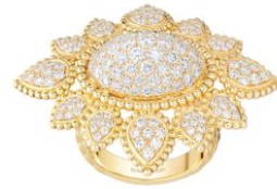
セルパンボエム ヴィンテージ リング 価格：3,735,600円（税込） 素材：イエローゴールド、ダイヤモンド(2.22ct)

70年代のムードをさらに際立たせるのが、手の甲全体に花開くようなデザインのダブルフィンガーリングです。パヴェダイヤモンドがセッティングされたアイコン的なドロップモチーフ、見事な彫刻技術によるゴールドビーズといったセルパンボエムの美学を映し出すコードを美しく昇華させました。