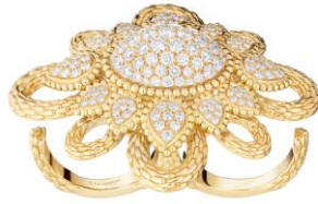
セルパンボエム ヴィンテージ トゥーフィンガー リング 価格：5,108,400円（税込） 素材：イエローゴールド、ダイヤモンド(2.22ct)