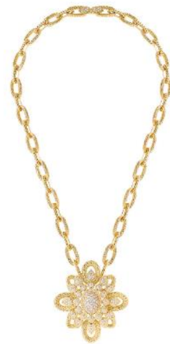
セルパンボエム ヴィンテージ ネックレス 価格：13,992,000円（税込） 素材：イエローゴールド、ダイヤモンド(5.71ct)

3種類のネックレスは、1974年のアーカイブの作品をベースに忠実にデザインされました。イエローゴールドとホワイトゴールドにダイヤモンドを贅沢に配したロングネックレス2種は、オリジナルの作品と同じサイズで制作されており、4つの方法でマルチウェアが可能な作品です。ネックレスのチェーンは複数のパーツを組み合わせているので、ロングネックレス、ショートネックレス、ブレスレットの3つのパターンで、ペンダントトップはブローチとしても着用することができます。マルチウェアはセルパンボエムの常に進化を続けるモダンなスピリットを象徴する大きな要素です。