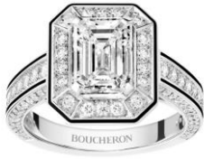
ヴァンドーム リズレ ソリテール リング (センターストーン:2ct)