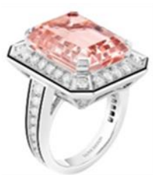
ヴァンドーム リズレ リング

また、「ヴァンドーム リズレ」コレクションの洗練されたモダンさと、大胆な色彩が融合したカラージュエリーが新たに加わります。優しいピンクの色合いのモルガナイト、フレッシュなブルーのアクアマリン、鮮やかなグリーントルマリンの新作は、いずれも10カラットを超える存在感のあるカラーストーンをセットしたデザイン性のあるジュエリーです。キャンディーカラーのような3色のリングに加え、モルガナイトとアクアマリンのペンダントも登場します。