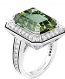
ヴァンドーム リズレ リング