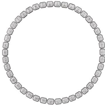
ヴァンドーム リズレ ネックレス