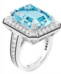
ヴァンドーム リズレ リング