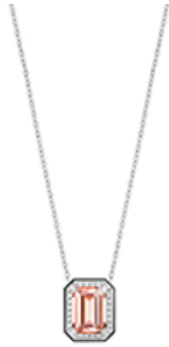
ヴァンドーム リズレ ペンダント