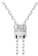
キャトル ダブルホワイト タイネckレス スモール 価格： ¥869,000 (税込) 素材： ホワイトゴールド、ホワイトセラミック、ダイヤモンド