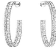
キャトル ラディアント フルパヴェ ダイヤモンド フープイヤリング