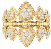
セルパンボエム 5モチーフ ダブルリング 価格：1,082,400円（税込） 素材：イエローゴールド、ダイヤモンド(0.5ct)