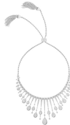
セルパンボエム マルチモチーフ ポンポン ネックレス 価格：15,180,000円（税込） 素材：ホワイトゴールド、ダイヤモンド(9.77ct)