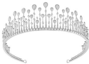
セルパンボエム マルチモチーフ ティアラ 価格：19,800,000円（税込） 素材：ホワイトゴールド、ダイヤモンド(15.79ct)