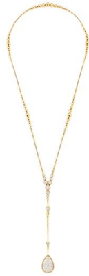
セルパンボエム ロングネックレス エクストララージ 価格：10,560,000円（税込） 素材：イエローゴールド、ダイヤモンド(6.5ct)