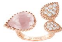
SERPENT BOHÈME PINK QUARTZ セルパンボエム 3モチーフ リング 価格：1,214,400円（税込） 素材：ピンククォーツ、ピンクゴールド、ダイヤモンド