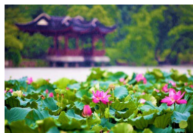
5月～9月は蓮の花のシーズンを迎える西湖

西湖は、2011年にユネスコの世界文化遺産に登録された広大な湖。その周りには見所がたくさんあり、歴史の趣を今に感じさせる美しい景色を遊覧船で楽しんだり、遊歩道をサイクリングしたりと、国内外から数多くの観光客が訪れる杭州一の観光スポットになっています。こうした杭州世界遺産の他にも、フェスティバルでは各種観光情報を取り揃えています。ぜひ、ご来場ください。