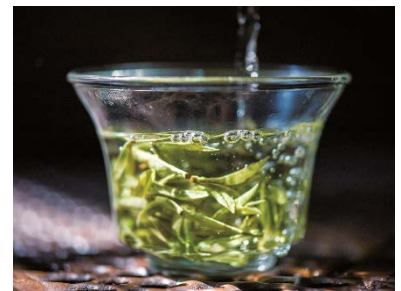
お土産としても人気の龍井茶

また、杭州無形文化遺産の篆刻、シルク、切り絵細工等が当たるプレゼント企画や、豪華プレゼントが盛りだくさんの抽選会の他、観光名所として欠かせない杭州の三大世界遺産である、西湖（せいこ）、京杭大運河（けいこうだいうんが）、良渚古城遺跡（りょうしょこじょういせき）等をご紹介します。