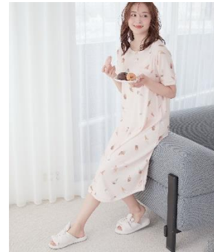
「胸ポケワンピース」