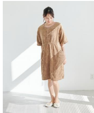
「前開き湯上りワンピース」