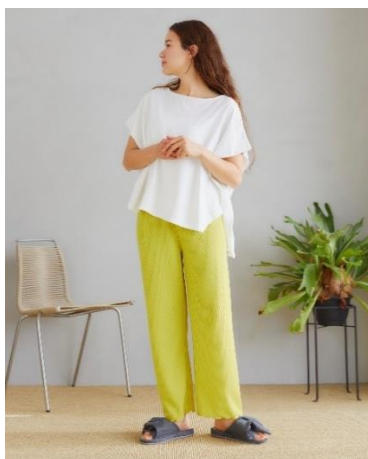
ワッフル (イエロー)