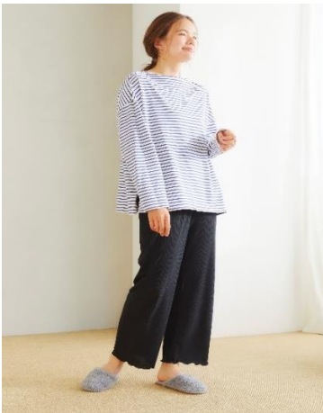
ランダムリブ (ブラック)

EC サイト : https://www.crossplus.jp/Form/Product/ProductDetail.aspx?shop=0&pid=663875&bid=crossmarche&cat=APPBOTPAN