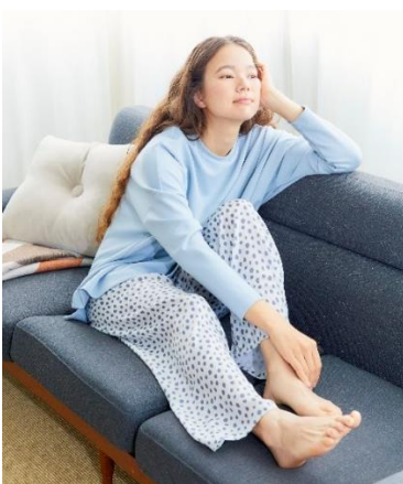
プリント (オフベージュ)