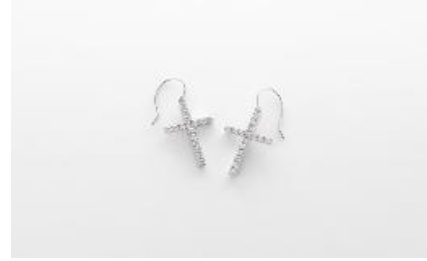
H064 ピアス 素 材：ラボグロウンダイヤモンド 0.15ct×2 メタル：PT/K18 価 格：S$ 1,880 ※画像は PT