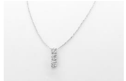
J005 ネックレス 素材：ラボグロウンダイヤモンド 0.90ct メタル：PT 価格：S$ 1,650