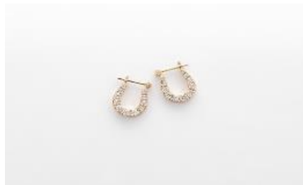
H061 ピアス 素 材：ラボグロウンダイヤモンド 0.25ct×2 メタル：PT/K18 価 格：S$ 1,450 ※画像は K18