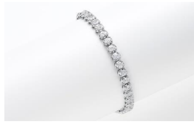
H068 プレスレット 素 材：ラボグロウンダイヤモンド 7.00ct メタル：PT 価 格：S$ 13,300