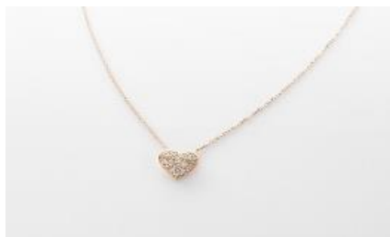
H062 ネックレス 素 材：ラボグロウンダイヤモンド 0.20ct メタル：PT/K18 価 格：S$ 1,200 ※画像は K18