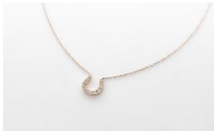
H061 ネックレス 素 材：ラボグロウンダイヤモンド 0.25ct メタル：PT/K18 価 格：S$ 1,100 ※画像は K18

他店に先駆けシンガポールにて先行発売される、ピアスやネックレス、ブレスレットの新作。クロスや馬蹄（ばてい）、ハートといった定番のモチーフのアイテムを、ラボグロウンダイヤモンドならではのボリューム感と価格でお楽しみいただけます。また、7ctから10ctのファンシーシェイプ（変形）のラボグロウンダイヤモンドを贅沢にあしらったテニスブレスレットも先行発売いたします。