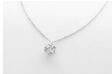
J004 ネックレス 素材：ラボグロウンダイヤモンド 1.50ct/2.00ct/3.00ct メタル：PT 価格：1.50ct S$ 2,900 2.00ct S$ 3,900 3.00ct S$ 6,600 ※画像は 2.00ct