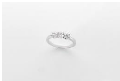
J005 リング 素材：ラボグロウンダイヤモンド 0.90ct メタル：PT 価格：S$ 1,650