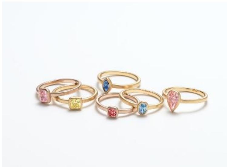
前列左から C013 (0.55ct)、C012 (0.50ct)、C012 (0.30ct)、C011 (0.28ct)、C010 (0.92ct) 後列 C009 (0.26ct)

POP UP 限定 カラーコレクションは色と形を厳選しているため、いずれも一点物となっております。