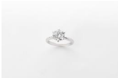
J004 リング 素材：ラボグロウンダイヤモンド 1.50ct/2.00ct/3.00ct メタル：PT 価格：1.50ct S$ 3,000 2.00ct S$ 4,300 3.00ct S$ 7,200 ※画像は 2.00ct

IMAYO ISETAN SCOTTS 店で限定発売する、1 粒タイプのリング、ネックレス、ピアスのコレクション。大粒のラボグロウンダイヤモンドを贅沢に楽しんでいただけるよう 1.5ct、2.0ct、3.0ct とバリエーションをそろえ、シンプルなデザインを施しました。このほか、デイリーなファッションアイテムとして使いやすい、0.3ct を 3 石使用した、同店限定のスリーストーンデザインのリングとネックレスもご用意しています。