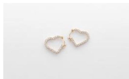
H063 ピアス 素 材：ラボグロウンダイヤモンド 0.20ct×2 メタル：PT/K18 価 格：S$ 1,380 ※画像は K18