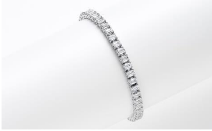
H067 プレスレット 素 材：ラボグロウンダイヤモンド 10.00ct メタル：PT 価 格：S$ 16,500