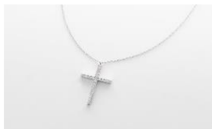
H064 ネックレス 素 材：ラボグロウンダイヤモンド 0.40ct メタル：PT/K18 価 格：S$ 1,600 ※画像は PT