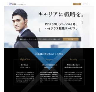
ハイクラス転職サービス サイトイメージ