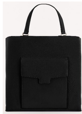
MAN ENEA L TOTE

Width 34 X Height 35.5 X Side 17.5 / レザー