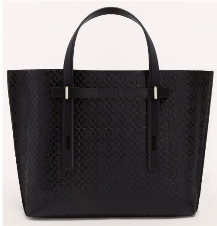
MAN GIOVE L CASUAL TOTE

Width 38 X Height 32 X Side 11 / レザー ¥77,000 (税込) / カラー: NERO