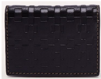
MAN SIRIO BUSINESS CARD CASE

Width 36 X Height 33 X Side 12 / レザー ¥84,700 (税込) / カラー: NERO