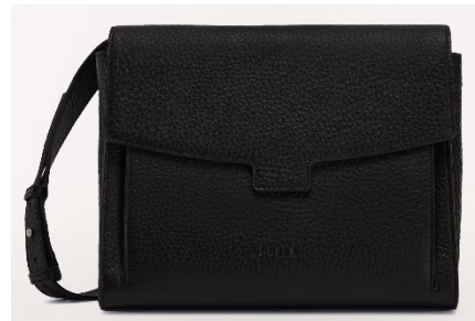
MAN ENEA M MESSENGER