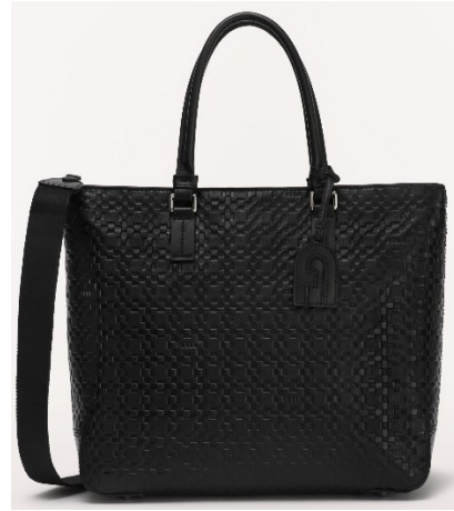
MAN SIRIO M TOTE

Width 38 X Height 32 X Side 11 / レザー ¥77,000 (税込) / カラー: NERO