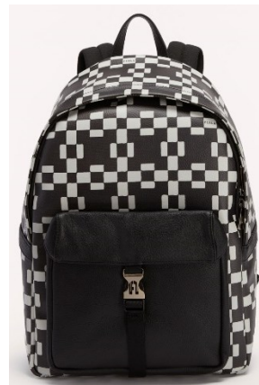
MAN COSMO M BACKPACK Width 28.5 X Height 40 X Side 13 レザー / ¥56,100 (税込) カラー: TONI PERLA+NERO

PRESS CONTACT: HIRAO INC 東京都渋谷区神宮前 1-11-11 #608, TEL: 03.5771.8808