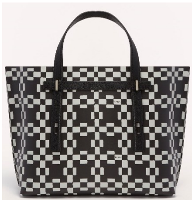
MAN GIOVE L CASUAL TOTE Width 38 X Height 32 X Side 11 レザー / ¥59,400 (税込) カラー: TONI PERLA