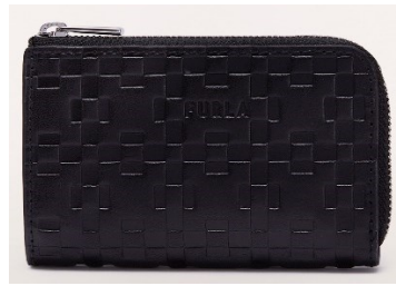
MAN SIRIO ZIP KEYCASE

Width 11 X Height 8 X Side 1.5 レザー / ¥20,900 (税込) カラー: NERO