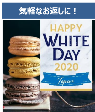
ホワイトデーギフト2020 Topaz(トパーズ)コース 価格：1,700円

「Gift Pad」オリジナル3種類の価格帯から選べる、2020年ホワイトデー限定カタログギフトコースです。