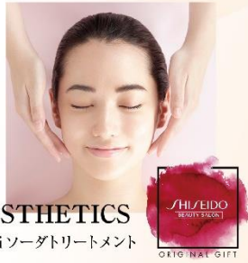
ESTHETICS Qiソーダトリートメント

資生堂美容室 ESTHETICS Qi ソーダ トリートメント(50分) 価格：10,700円