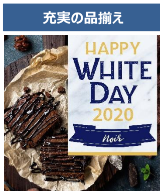
ホワイトデーギフト2020 Noir(ノワール)コース 価格：3,700円