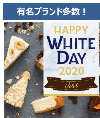
ホワイトデーギフト2020 Vert(ヴェール)コース 価格：5,700円