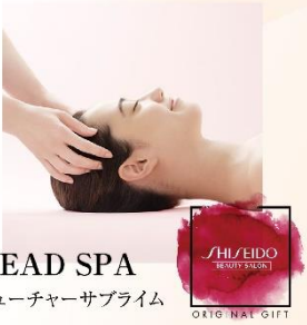
HEAD SPA フューチャーサブライム