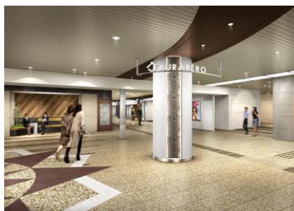
▲ ゾーン東側 エントランス イメージ

ショップファサードに古き良き“蔵”をモチーフに提灯のような丸い突出しサインと合わせて奥へと引き込む効果やポイントで家紋や文様をイメージするようなモダンデザインセラミックタイルを使用し、ゾーン全体の統一感を高めています。