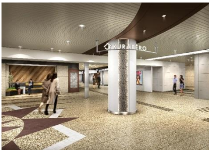
▲ ゾーン東側 エントランス イメージ

古き良き“蔵”をモチーフとしたショップファサードに加え、提灯のような丸い突出しサインと合わせて奥へと引き込む効果を演出。さらに、ポイントで家紋や文様をイメージするようなモダンデザインセラミックタイルを使用し、ゾーン全体の統一感を高めています。