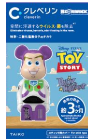
【バズ・ライトイヤー】