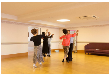
【サークル活動「社交ダンス」】