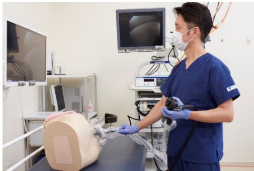
大腸内視鏡検査における使用イメージ