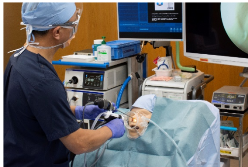
鼻の内視鏡手術における使用イメージ