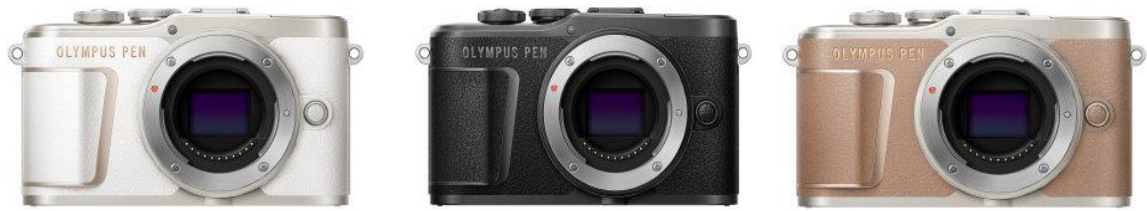
「OLYMPUS PEN E-PL10 ボディー」 (ホワイト/ブラック/ブラウン)