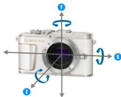
“ぶれない高画質”を実現する ボディ内手ぶれ補正(イメージ)

夜景や暗い屋内、望遠レンズでの撮影、動画・セルフィー撮影など、手ぶれの発生しやすいシーンでも強かに手ぶれを抑えるボディ内手ぶれ補正機構※2 を搭載しています。また、オリンパスのプロフェッショナルモデルと同じ画像処理エンジン「TruePic VIII」を採用し、暗いシーンでもノイズを抑えたクリアな写真を撮影できます。ボディ内手ぶれ補正機構と「TruePic VIII」の組み合わせにより、一眼カメラならではの“ぶれない高画質”を実現しています。