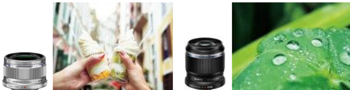
単焦点レンズ「M.ZUIKO DIGITAL 25mm F1.8」 マクロレンズ「M.ZUIKO DIGITAL ED 30mm F3.5 Macro」

ボケを活かした撮影が楽しめる明るい単焦点レンズやマクロレンズなど、「OLYMPUS PEN E-PL10」に最適な小型・軽量、高性能の交換レンズを豊富に揃えています。撮影シーンに適したレンズを選べるため、写真表現の幅が格段に広がります。