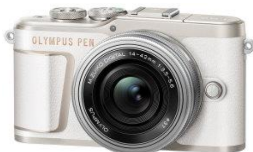
「OLYMPUS PEN E-PL10 14-42mm EZ レンズキット」 ボディー(ホワイト)+「M.ZUIKO DIGITAL ED 14-42mm F3.5-5.6 EZ」