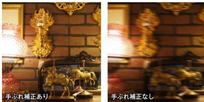
手ぶれ補正効果(イメージ)