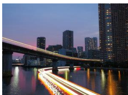
「ライブコンポジット」画像イメージ