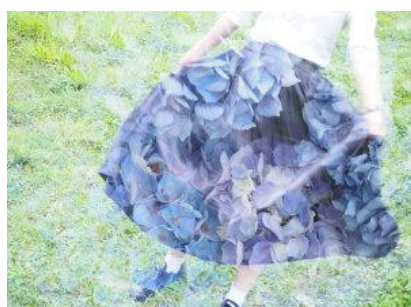
「多重露出」画像イメージ

専門的なテクニックが必要な写真表現が手軽に楽しめる撮影機能を AP モードにまとめています。2枚の写真を重ねて合成する「多重露出」や、星空や車のライトなどの光跡を最適な明るさで撮影できる「ライブコンポジット」なども簡単な操作で撮影することができます。シャッター音や操作音を OFF にできる「静音モード」は P/A/S/M/ART モード時でも選べるようになっています。