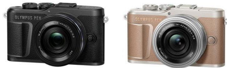
「OLYMPUS PEN E-PL10 14-42mm EZ レンズキット」 ボディー(ブラック/ブラウン) +「M.ZUIKO DIGITAL ED 14-42mm F3.5-5.6 EZ」