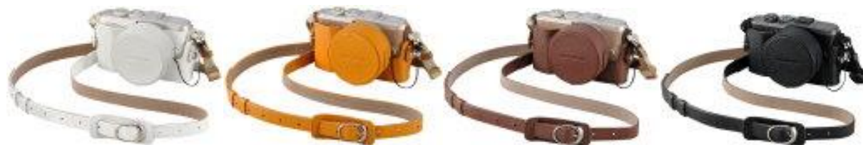
本革ボディージャケット「CS-45B」、本革ショルダーストラップ「CSS-S109LL II」 および本革レンズジャケット「LC-60.5GL」カラーバリエーション

デザイン性とカメラを保護する機能性を兼ね備えた本革アクセサリです。カラーバリエーションはホワイト、ライトブラウン、ブラウン、ブラックの4色で、スタイルに合わせて選ぶことができます。