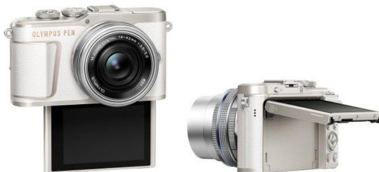
可動式液晶モニター使用イメージ

スマートフォン感覚で液晶モニター上の被写体にタッチするだけで、ピント合わせと同時にシャッターが切れる、タッチ AF シャッターを備えています。液晶モニターを下に開くと、自動的に自分撮りモードに切り替わり、簡単にセルフイーが楽しめます。さらに、肌を明るくなめらかに補正する「e ポートレート」や動画撮影なども画面上から選択できます※ 3 。また、液晶モニターの角度を変えることで、さまざまなアングルの撮影が可能です。