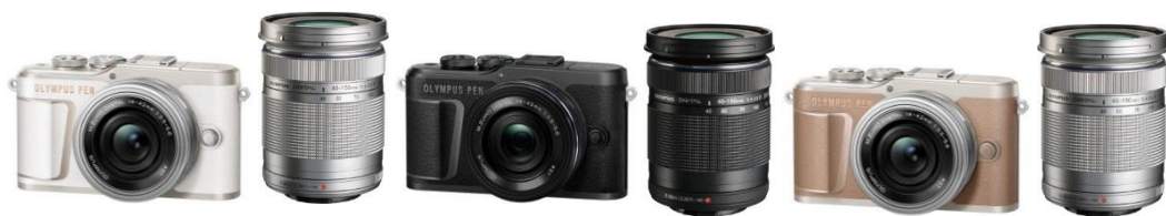
「OLYMPUS PEN E-PL10 EZ ダブルズームキット」 ボディー(ホワイト/ブラック/ブラウン) +「M.ZUIKO DIGITAL ED 14-42mm F3.5-5.6 EZ」 +「M.ZUIKO DIGITAL ED 40-150mm F4.0-5.6 R」