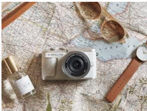
シンプルで調和の取れたデザイン

「OLYMPUS PEN E-PL10」は、ホワイト、ブラック、ブラウンの3色展開です。革調素材の色や表面仕上げの細部の質感にまでこだわりました。どんなスタイルにも合わせやすいシンプルで調和の取れたデザインに仕上がっています。また、標準キットレンズの「M.ZUIKO DIGITAL ED 14-42mm F3.5-5.6 EZ」と組み合わせても500mlのペットボトル1本よりも軽く、携帯性にも優れています。