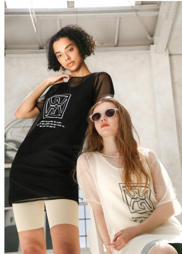
MW SHEER LAYERD DRESS 20,000 KNIT HALF LEGGINGS 8,000