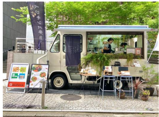
キッチンカー(イメージ)