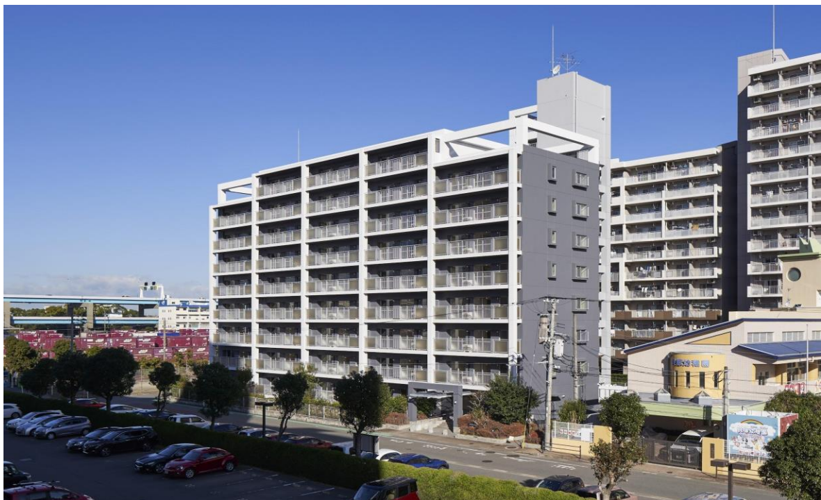
福岡市箱崎エリア貝塚地区の「L-PLACE KAIZUKA(エルプレイス貝塚)」

本物件は、地上9階、総戸数42戸の賃貸マンションとして、リノベルが企画・設計施工を担い、大和ライフネクストがサブリース・管理運営を実施します。大和ライフネクストおよびリノベル2社ともに福岡では初の一棟リノベーションとなり、また、大和ライフネクストとリノベルは今回が初の協業となります。