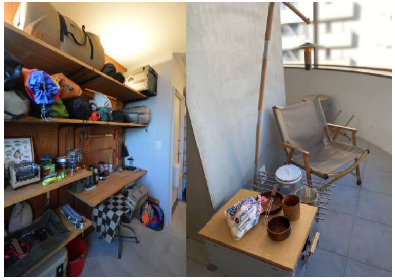
キャンパーの暮らす一室を再現した「リノベル。神奈川 桜木町ショールーム」