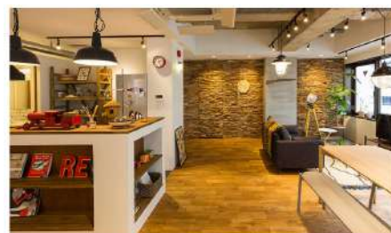
【キャンプ用品収納&出し入れに便利！】玄関土間・間取り・動線工夫を解説 アウトドア好きのための『中古を買ってリノベーション』相談会＋見学会 ● 桜井 田舎館ショールーム

詳細： https://www.reoveru.jp/events/sr01_sakuragicho/showroom-sakuragicho