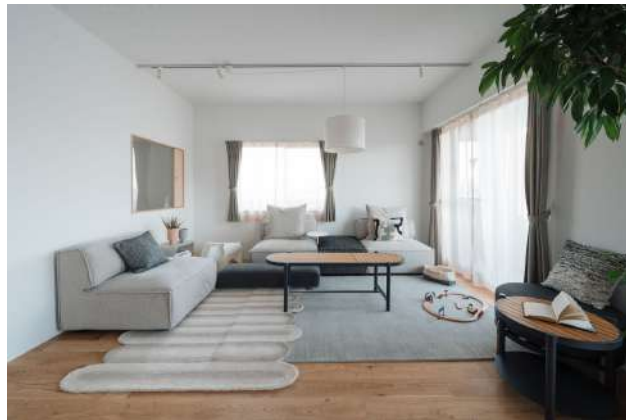
『The R. by リノベる。』コンセプトルーム。スタイリング前とスタイリング後