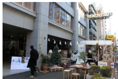
昨年開催したマーケットの様子

出店：Archéologie Studio、SANDS furniture、PORTER SERVICES、yaso Saten Proust など