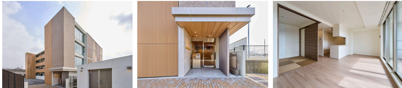
オーシー レジデンス アール 王寺 外観・専有部

奥村組とリノベるは、奥村組のパーパス（企業理念）『人と自然を、技術でむすぶ。』に基づき、2025年3月までに竣工予定の6棟に共通するグランドコンセプトを策定しました。持続可能な建物と持続可能な事業を目指し、大規模修繕や設備・デザインの更新はもちろん、緑と人をつなぐ空間づくりや、まちに開くスペースなどをプロジェクトごとに盛り込んでいます。