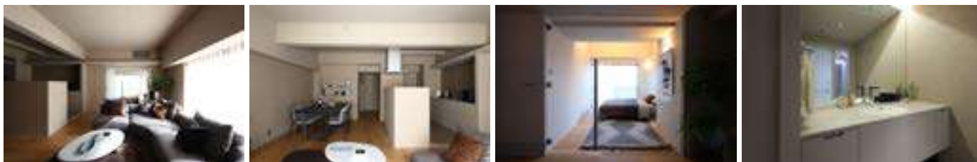
▲二子玉川 The R. by RENOVERU 【G1】コンセプトルーム

G1：忙しい日常に癒しの時間を： 仕事や家事に追われ落ち着いた時間がとれない方に、ゆったりとした癒しの時間をお届けします。全自動浴槽や自動洗浄トイレなど、家事を楽にしてくれる設備機器や、優しく落ち着いた色や上質な素材と照明による演出で、くつろぎと癒しのひと時を提供します。※リノベーション価格（参考）：税込2,025万円程度～（60㎡の場合）