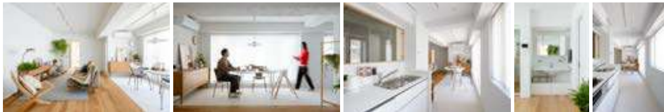
▲乃木坂 The R. by RENOVERU 【E1】コンセプトルーム

E1：変わらない本物の価値： 素材や質感はシンプルで上質。多くの方に支持されるリノベーションの定番を追求しました。白い器のように余白のあるデザインは、住まい手に合わせて多様に变化し、インテリアや雑貨、アートが映える背景となります。※リノベーション価格（参考）：税込1,235万円程度～（60㎡の場合）