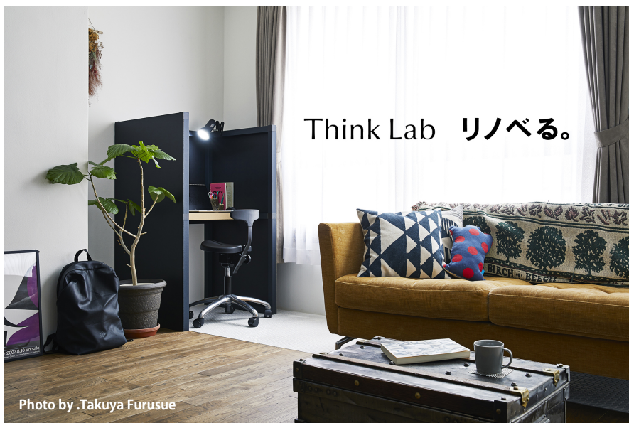
「リノベる。東京 銀座・有楽町ショールーム」にて部屋の一角に「Think Lab HOME」を設置した様子

「リノベる。」では気軽にリノベーションを知る機会として、今後も定期的なインスタライブなどの開催や情報発信を行い、「自分らしく暮らす気づきやきっかけ」をご提供していきます。