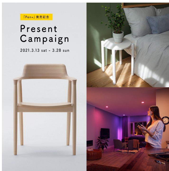
『Pen+ リノベーションで実現する、自分らしい暮らし。』発売記念プレゼントキャンペーン メインビジュアル

リノベル。公式Instagramをフォローし、該当キャンペーンの告知投稿に「理想の住まい・暮らし方」をコメントをいただいた方の中から抽選で、日々の暮らしを豊かにする素敵なアイテム3種類を6名様にプレゼントいたします。