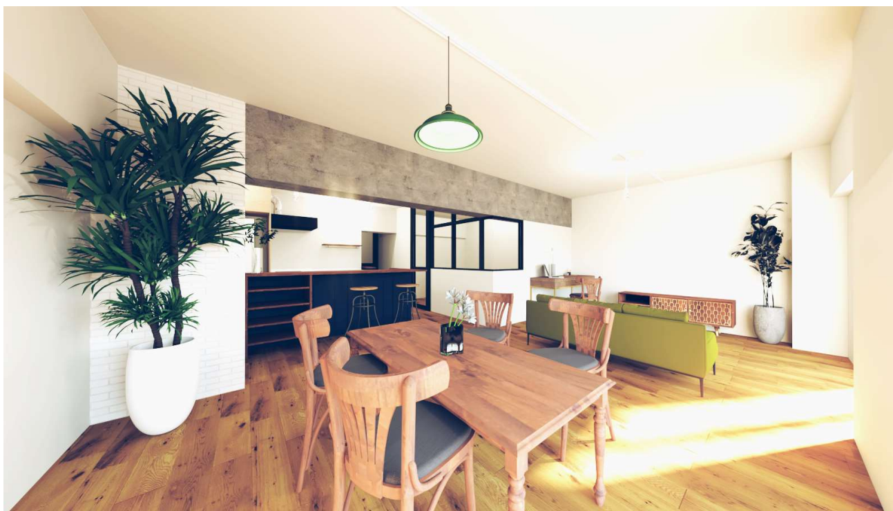
「リノべる。大阪 江坂ショールーム」イメージ画像

LDKを中心とした家族のだんらんと在宅ワークをテーマにしたリノベーション空間を再現しており、非接触が叶う最新のIoT機器を連携したスマートホームもご体感いただけます。今後、中古住宅購入やリノベーションについて気軽に学べるセミナーや予約制相談会などを随時開催してまいります。