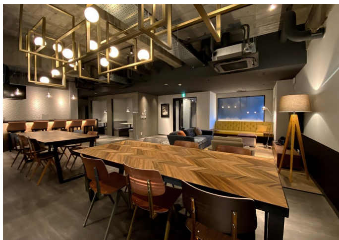
左から、施工後/外観写真、共用部ラウンジ内観写真