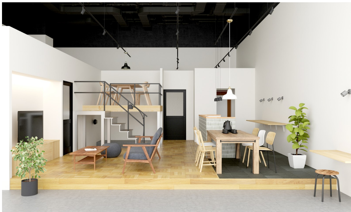
「リノベる。愛知 名古屋 久屋大通ショールーム」イメージ画像

ファミリーでの暮らしを想定した約70㎡のショールームは、ご夫婦でも在宅勤務を可能にする複数のワークスペースや、非接触が叶うさまざまな機器類を連携した最新のスマートホームも導入。コロナ禍によって注目されるニューノーマルな暮らしに対応する住まいづくりの工夫も紹介いたします。今後、中古住宅購入やリノベーションについて気軽に学べるセミナーや予約制相談会などを随時開催してまいります。