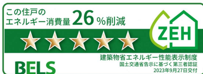
BELS 認証「ZEH Oriented」を取得した第一号案件「グリーンシティ 鷺沼」