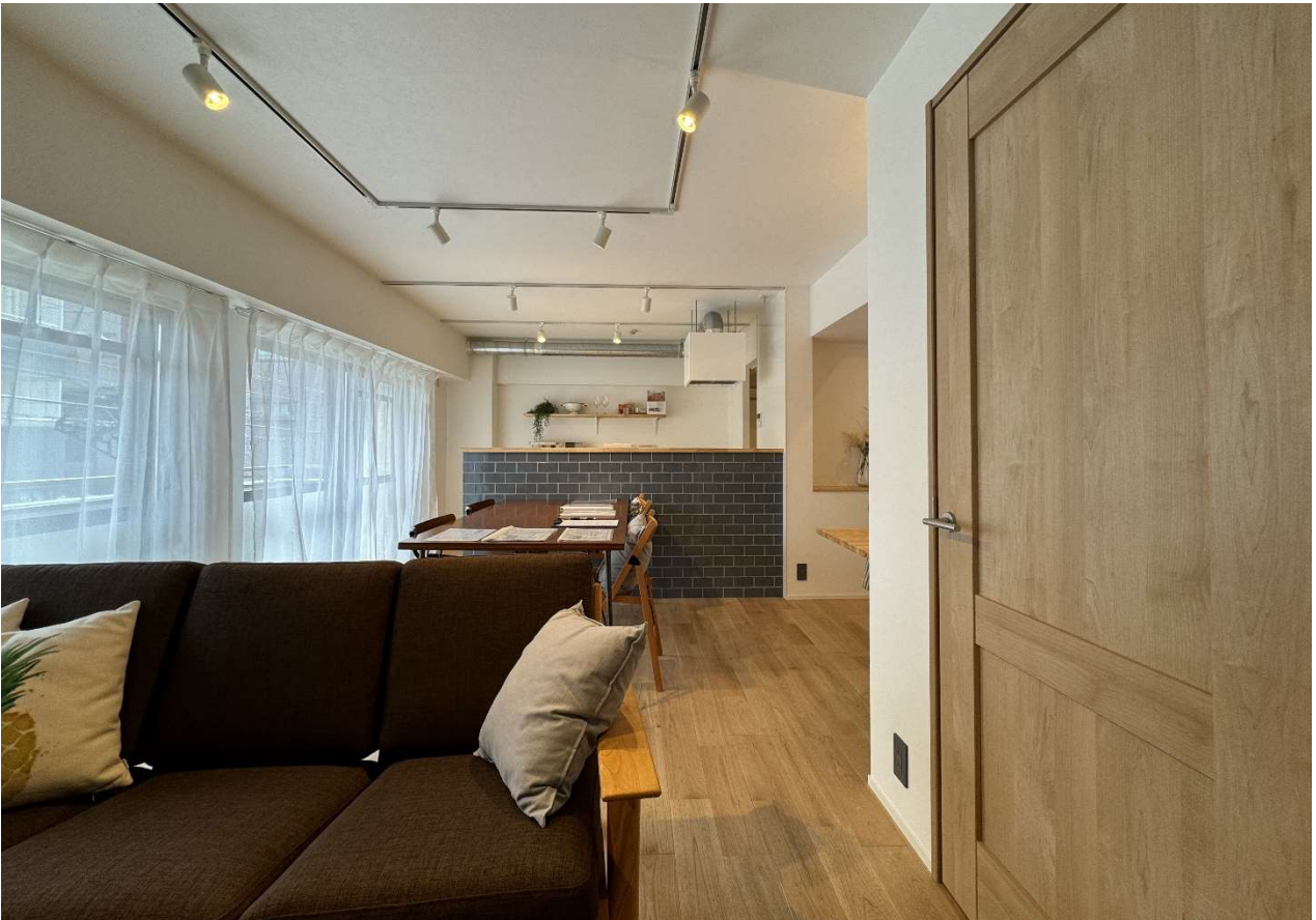
(上段左) 施工前、(上段右) 断熱施工済み、(下段) 施工後