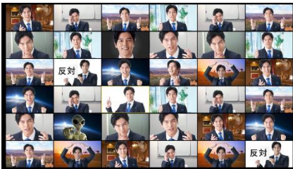
新しい生活様式 要オンライン篇

2020年9月28日(月)よりWEBサイト ( https://www.uruorich.jp/ ) にて公開