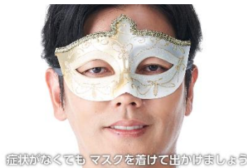
症状がなくても マスクを着けて出かけましょう