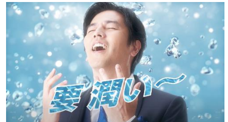
仕事場で忘れてはいけないこと篇