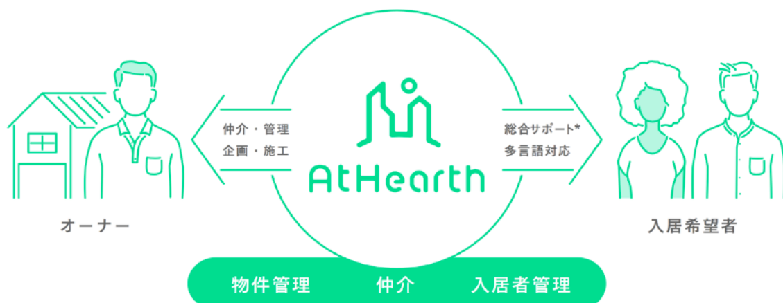
サービスモデル図