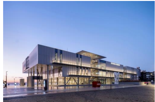
イスタンブル・モダン美術館

*「建築界のノーベル賞」といわれ、世界中で活躍する建築家の業績を讃えて贈られる賞