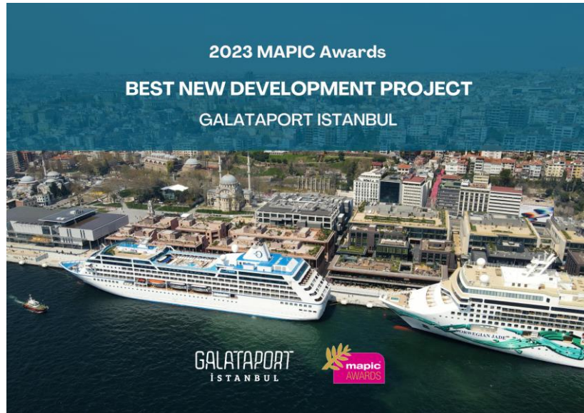
MAPIC アワード 2023「最優秀新開発プロジェクト」受賞、ガラタポート

トルコのイスタンブル、カラキョイ地区の中心部に位置するガラタポートが、11月末にフランスのコンヌで開催された MAPIC アワード 2023 で「最優秀新開発プロジェクト」を受賞しました。今回の受賞により、ガラタポートとカラキョイ地区は、街の新たな魅力の中心地としての名声を高めました。