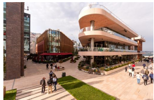
ガラタポート 外観

ガラタポートがあるカラキョイ地区は、ガラタ橋の近く、同名のガラタ塔の下に位置しており、金閣湾岸からボスポラス海峡にかけてのエリアをカバーしています。イスタンブルで最も古く歴史的な地区のひとつであり、重要な商業の中心地であったカラキョイ地区は、今日、豪華な宿泊施設からショッピング、レストラン、モダンアートセンターまで、あらゆるものが揃っているイスタンブルで訪れるべき必見のスポットとなっています。歴史的、建築的に重要なジャーミイ、教会、シナゴグがあることでも知られて