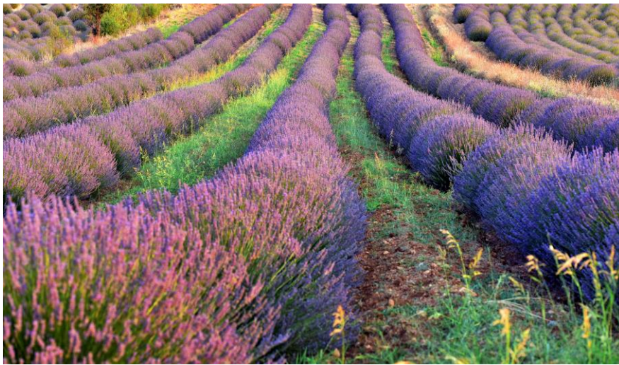
クユジャク村 ラベンダーガーデン

トルコの花園として知られる地中海地方のイスパルタは、近年「エコツーリズムで訪れるべき場所」として人気を博し、鮮やかなバラ園や紫色のラベンダー畑に観光客が集まっています。甘い花の香りと息をのむような自然の素晴らしさ、多様なレジャースポーツ、美味しい料理、美しい庭園によって、イスパルタは、必ず訪れるべきスポットとなっています。また、イスパルタは「2023年訪れるべき旅行先 Top50」にランクインしたトルコ湖水地方の一部にも属しています。