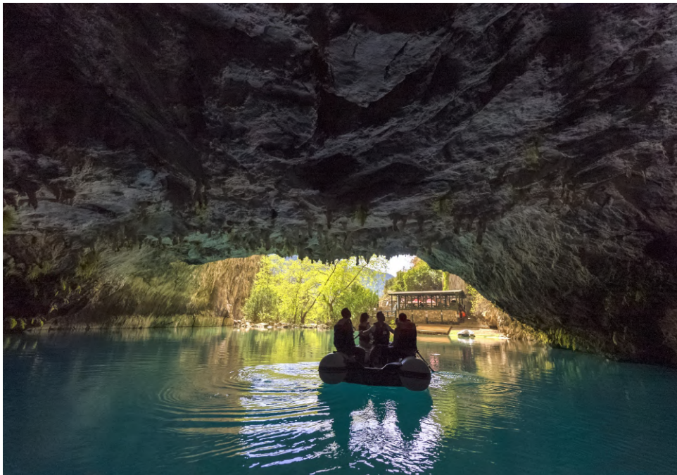
アルティンベシク洞窟

トルコリビエラの中心、アンタルヤは冒険を求める人々にとって理想的な場所で、数多くの洞窟が人類の歴史を語り継いでいます。