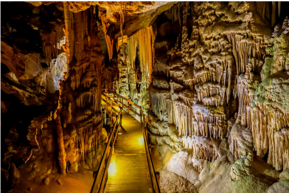
ダムラタシュ洞窟

トルコには約 40,000 もの洞窟が点在しており、洞窟探検家にとってはまさに夢のような場所です。地下に広がる神秘的な湖や美しい鍾乳石、石筍を探訪することで、まるでファンタジー映画の世界に迷い込んだかのような感覚に浸ることができます。今回は、そんなトルコで絶対に訪れるべき 6 つの壮大な洞窟をご紹介します。