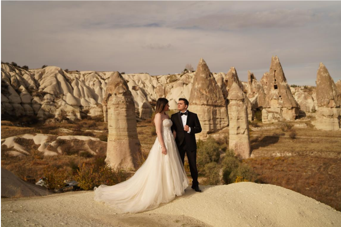
カッパドキアでの結婚式

結婚式を計画する中で、「他とは違う特別な場所で結婚式を挙げたい」と思ったことはありませんか？