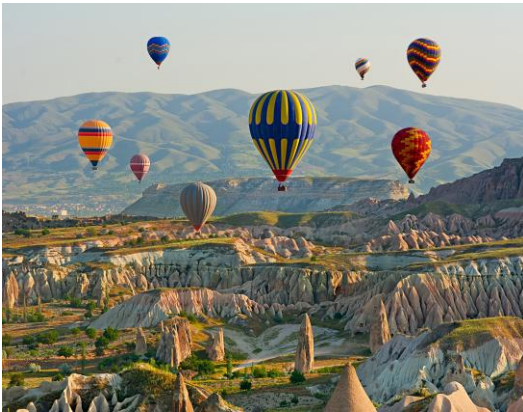
フェアリー・チムニー

妖精の煙突が点在する美しい谷間の中で誓いを交わしたり、魅力的な洞窟ホテルで愛を祝ったり、星空の下、屋上テラスでレセプションを開いたりする結婚式はいかがですか？さらに、熱気球で結婚式を挙げるというユニークな体験も可能です。カッパドキアには、親しい集まりから豪華な祝宴まで、あらゆるスタイルに対応した素晴らしい会場があります。