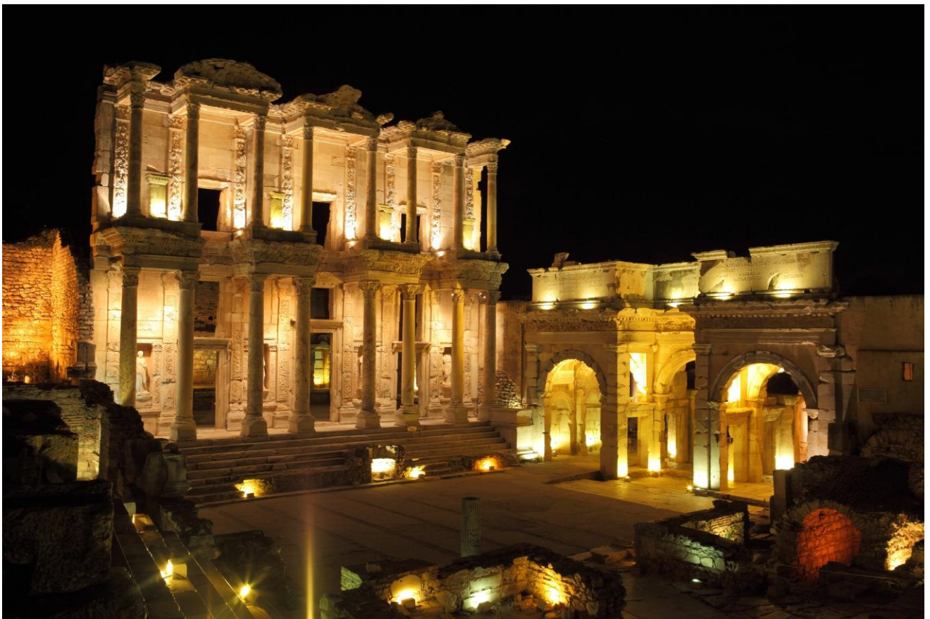
ライトアップされた世界遺産「エフェソス遺跡・ケルスス（セルシウス）図書館」

2026年8月2日（日）、トルコ共和国（以下、トルコ）西部イズミル県の世界遺産・エフェソス遺跡にて、日本人観光客の皆様だけを対象とした特別イベント「エフェソス・ジャパండిイ」が開催されます。