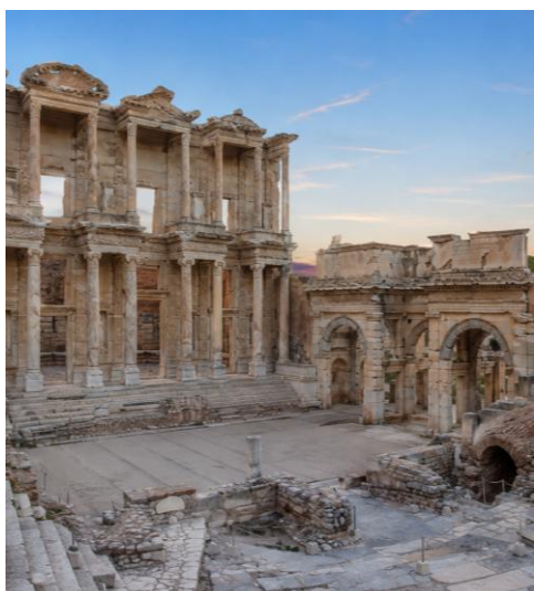
ケルスス図書館 (19 時頃のイメージ)

https://www.youtube.com/watch?v=bagK9DJVEgs