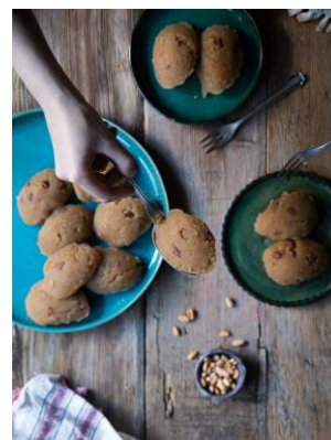
テレヤールウンヘルヴァス

ユニークな地形を持つカッパドキアは、美味しい料理の故郷でもあります。伝統的な土窯で、肉、野菜、レンズ豆を土鍋でじっくりと煮込む土鍋ケバブ”テスティケバブ”やこの地方で採れたブドウの果汁を使ったトルコ風デザートキョフテュル”、オーガニックのハチミツと一緒に食べるのが一般的なドライクリーム”クルカイマク”、小麦粉のヘルヴァにバターを添えた”テレヤールウンヘルヴァス”なども、ぜひ試していただきたい郷土料理です。