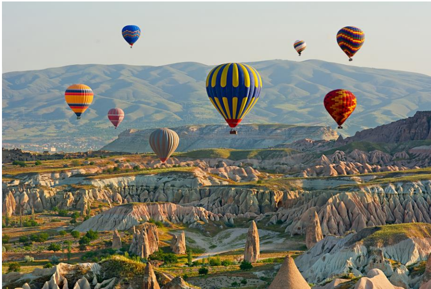
熱気球のスカイツアー

ユニークな形の岩、何十メートルものトンネルを持つ壮大な地下都市、岩に彫られた家々や教会・修道院、他では体験できない熱気球、幻想的な洞窟ホテルなど、別世界のような風景が広がるトルコ中央部に位置するカッパドキアは、日本人旅行者にも人気のエリアです。秋になると木々が美しく色づき始め、紅葉の素晴らしいカッパドキアのベストシーズンを迎えます。