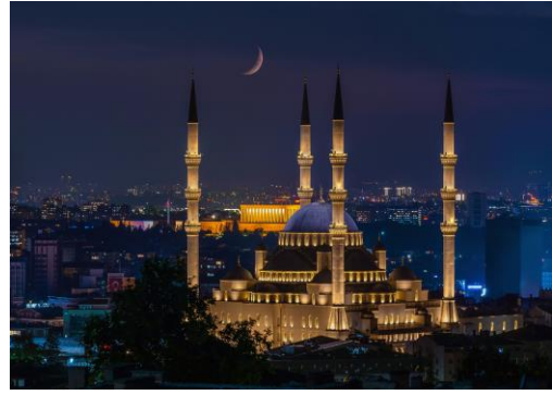
人気投票第二位“コジャテペのハートにて”