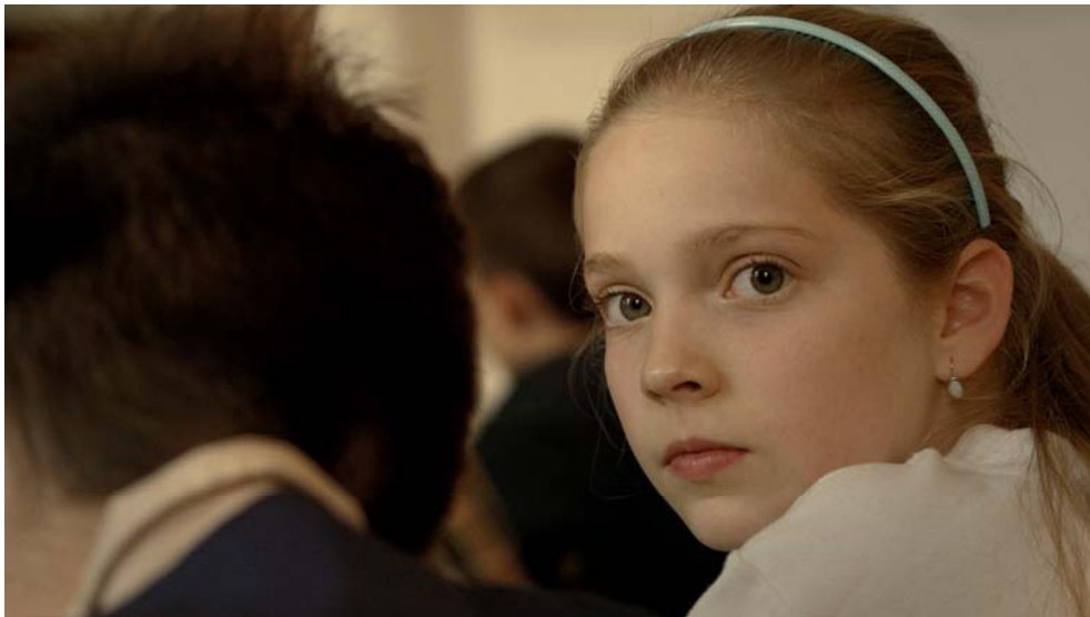
『SING/合唱』監督:Kristof Deak /ハンガリー/ドラマ/2015/

～ 米国アカデミー賞公認の国際短編映画祭プロデューサーが語るショートフィルムの世界～