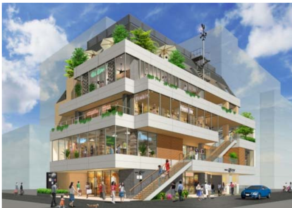
<「HULIC & New KICHIJOJI」の完成予想図。最上階に STUDIO 吉祥寺を開設>

STUDIO 吉祥寺の他、「HULIC & New KICHIJOJI」には、スポーツからグルメ等、多彩なテナントが入居予定となり、吉祥寺の街に新しい交流を生み出していきます。