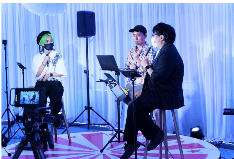
▲卒業生・在学生らによる映像配信 (YouTube Live)