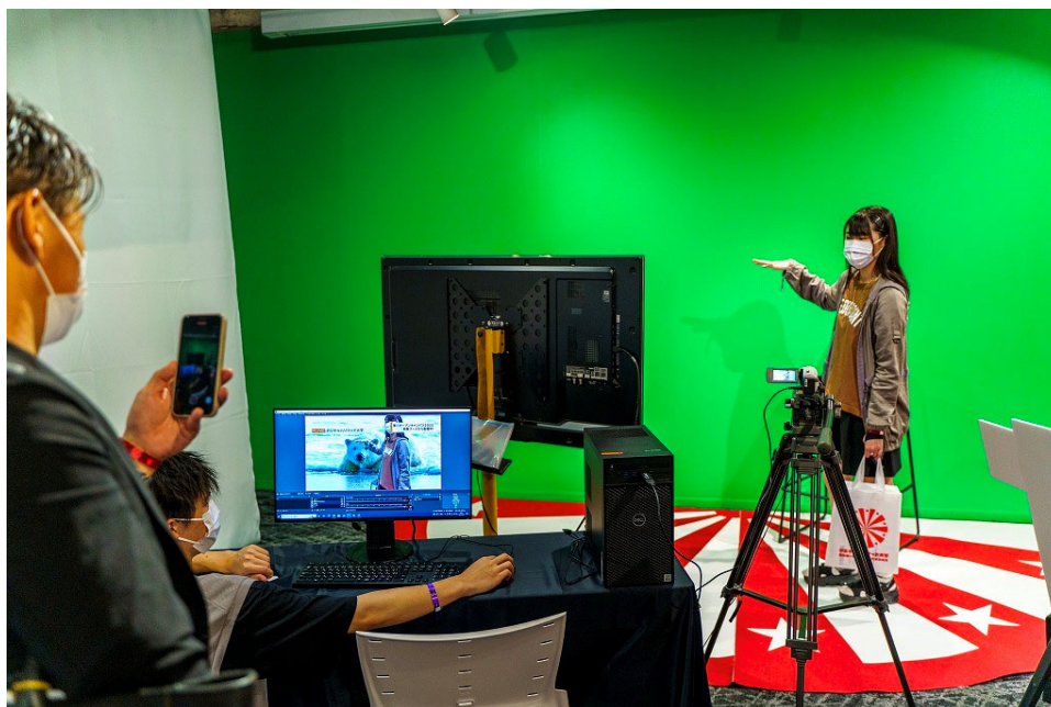
▲グリーンバック撮影体験