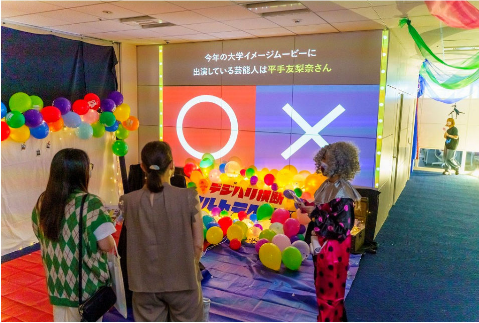
▲デジハリ横断ウルトラクイズ(クイズ風大学紹介)