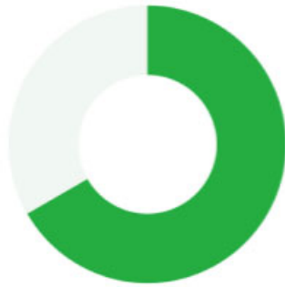
学部属性 文系学生63%