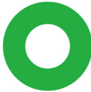
プログラム満足度 100%