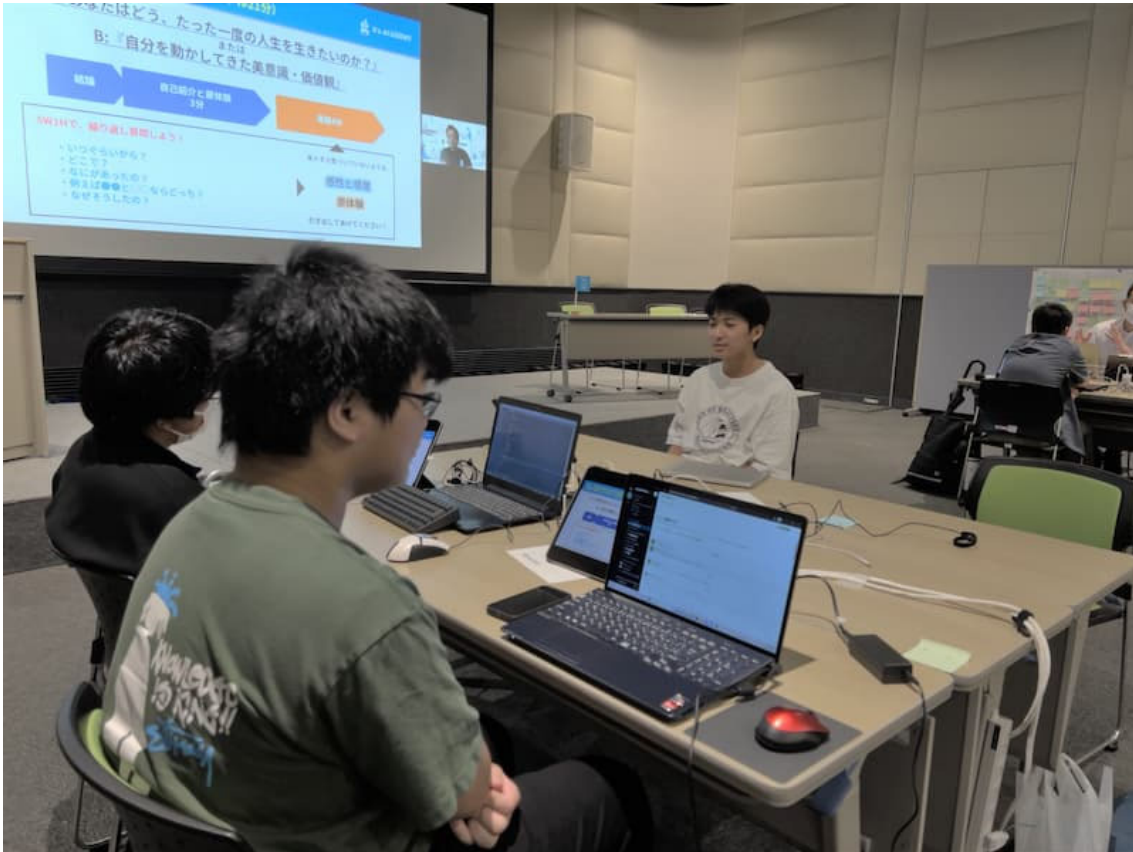
自分では思いもなかった価値観に気づいたり、共通点を見つけたりと会話が弾んでいました。