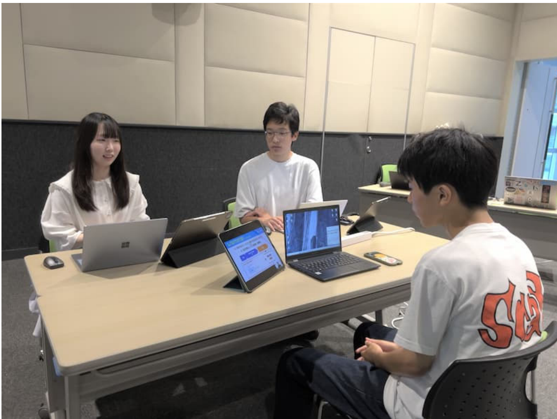
2日目の終盤では、いよいよオリジナルアプリの制作に入ります。 皆さん真剣な表情で、アプリ制作に取り組んでいました。