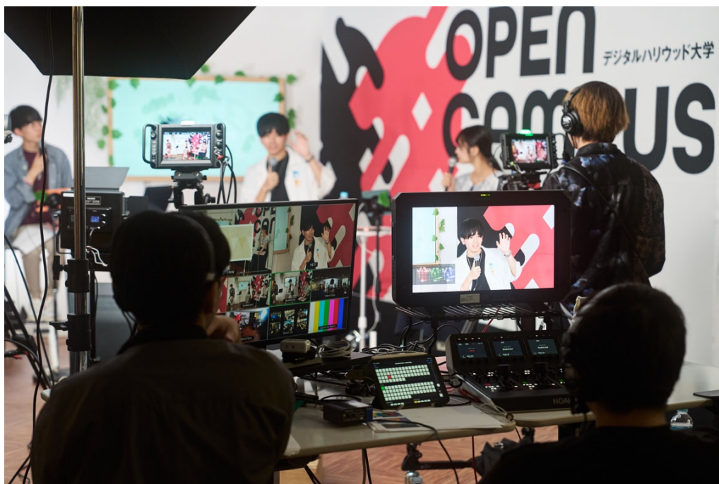
▲YouTube Live での生中継(卒業生・在学生による映像配信)

https://www.dhw.ac.jp/news/20230921_summeroc2023