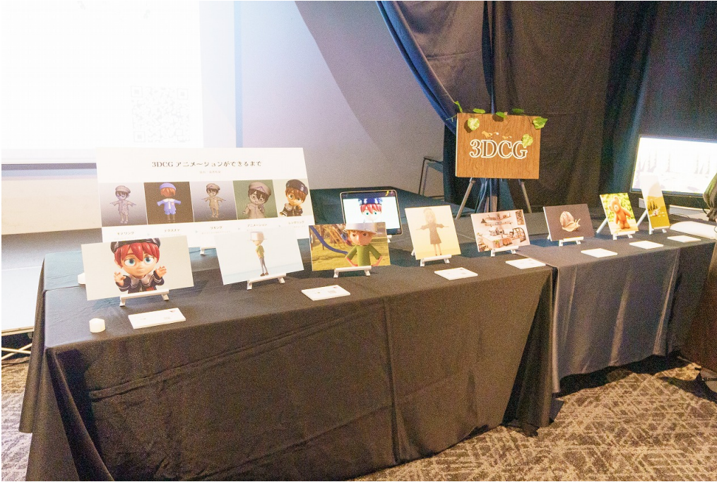
▲ 作品展示コーナー