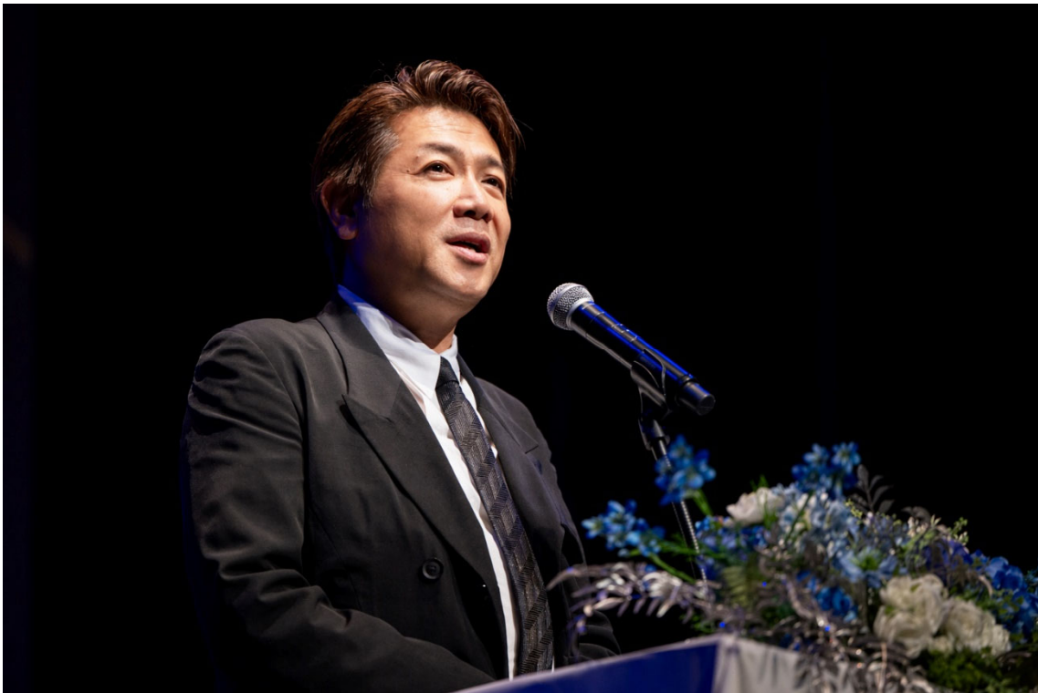
米国アカデミー賞公認、日本発・アジア最大級の国際短編映画祭 「ショートショート フィルムフェスティバル&アジア」代表、俳優の別所哲也氏

続いて、米国アカデミー賞公認、日本発・アジア最大級の国際短編映画祭「ショートショート フィルムフェスティバル & アジア」の代表を務められており、俳優でもある別所哲也様よりご祝辞をいただきました。