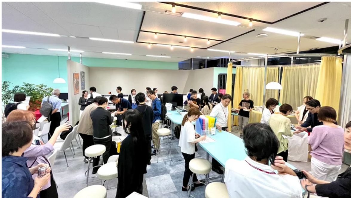
<過去の企業マッチングイベントの様子>

これらの実績を踏まえ、今回はコース受講からキャリア出口支援までをより体系的に設計した「TAMA GO WORK PASS」として、2026年8月の第2回開催に向けて本格始動します。