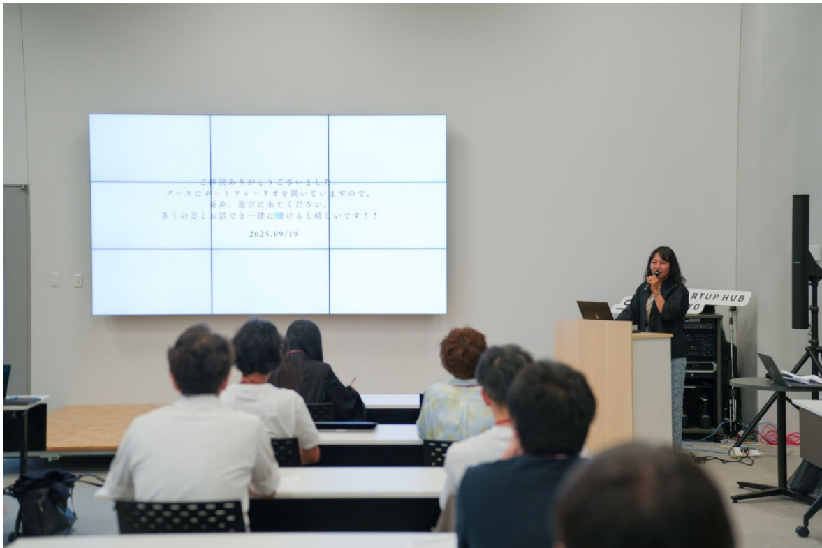
<クリエイターズオーディション in 多摩の様子(前回開催時)>

デジタルハリウッド STUDIO 立川では 2022 年より、多摩エリアに特化した出口支援として「ローカルワークデザイン講座 in 多摩(たまご講座)」を開講。前回(2026 年 3 月)の開催では講座参加者 15 名、マッチングイベント参加企業 8 社・参加者 12 名が集まり、内定者を輩出。イベント満足度は 5 段階中 4.44 を記録しました。