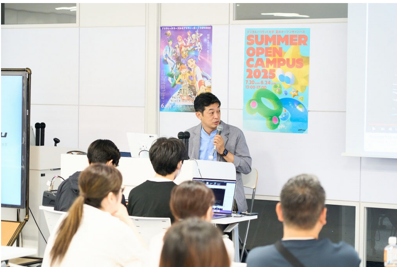
△現役プロによる体験授業