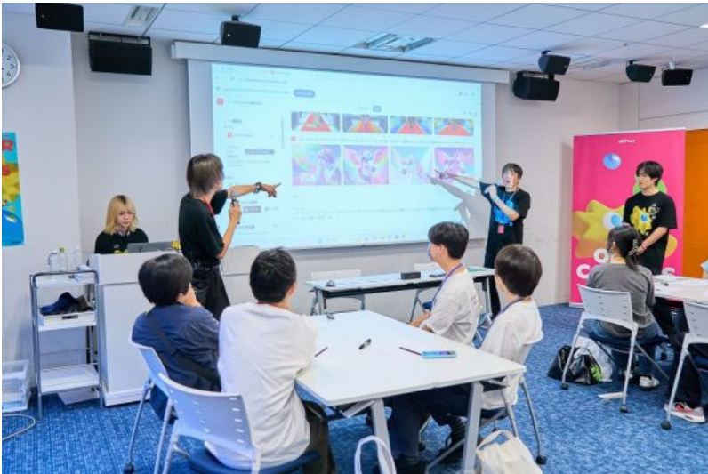
△ワークショップ(ミニオータム・トライアウト)