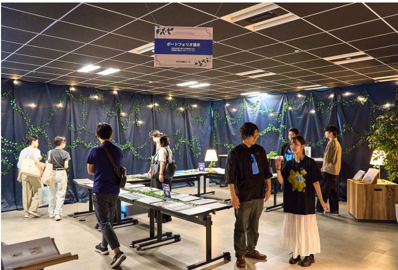
△ポートフォリオ展示&相談コーナー