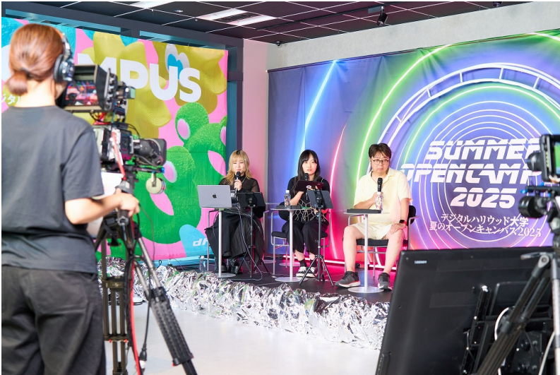
△YouTube Live での生中継（卒業生・在学生による映像配信）