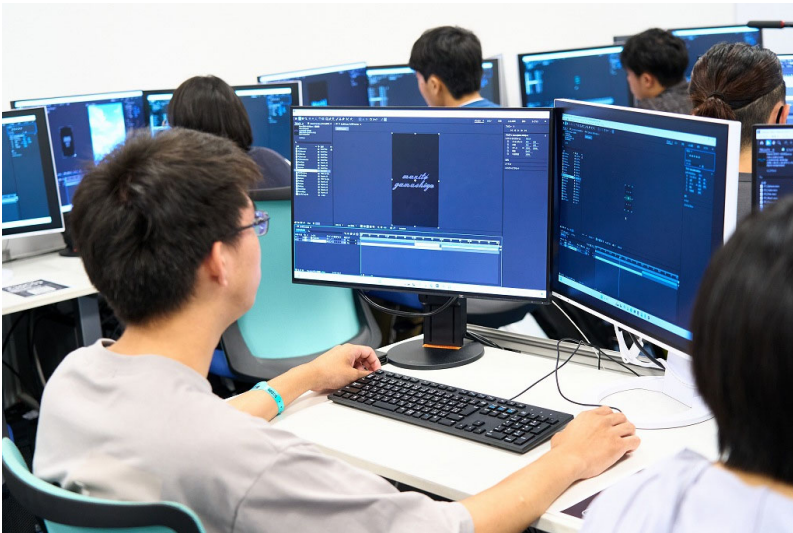
△PC を用いたデジタル制作体験